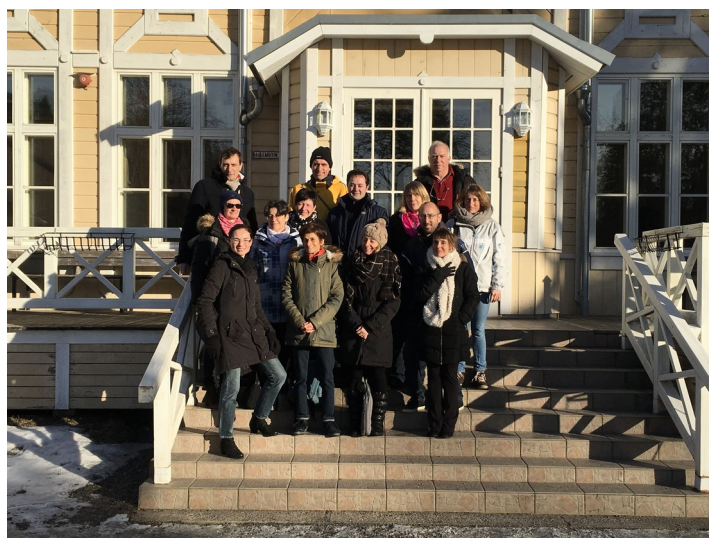
Au West Finland College