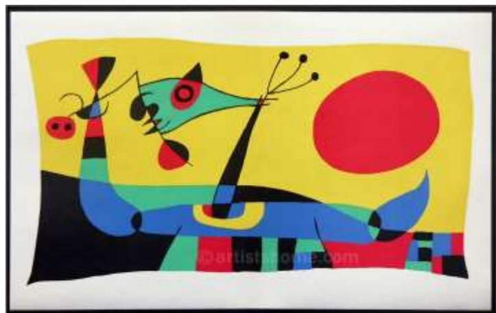
Plumes du paon Miro - 1956

Rends-toi sur ce site http://museosphere.paris.fr/oeuvres/dendrite-paysage-imaginaire pour y voir des peintures de Georges Sand qui peignait des paysages imaginaires à partir de taches.