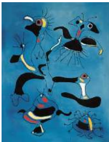
Oiseaux et insectes Miro - 1938

Découvre des artistes qui ont exploité ce thème :